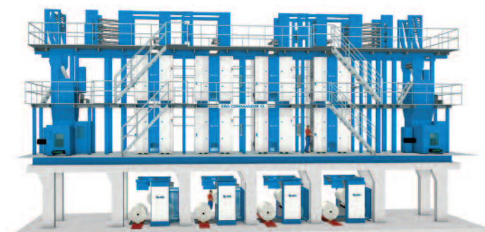
Die hoch automatisierte Commander CL-Anlage für den KBA-Stammkunden ›Heilbronner Stimme‹.

Außerhalb des Kerngeschäfts mit der gedruckten Zeitung nutzt die Mediengruppe mit ihren über 600 Mitarbeitern die elektronischen Medien. Neben einer Beteiligung am privaten Radiosender ›Radio Ton‹ haben die Heilbronner mit stimme.de das führende Onlineportal der Region mit über 351.000 Unique User im Monat. Die für die Mobil- und Internetaktivitäten verantwortliche Unternehmenssparte stimme.net bietet als Webagentur ihre Dienstleistungen an. Ein weiterer Geschäftsbereich ist die adressierte Postzustellung über das Tochterunternehmen RegioMail.